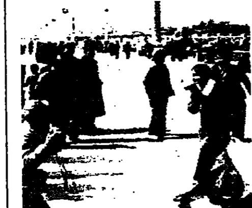
لهر في ساحات بكين